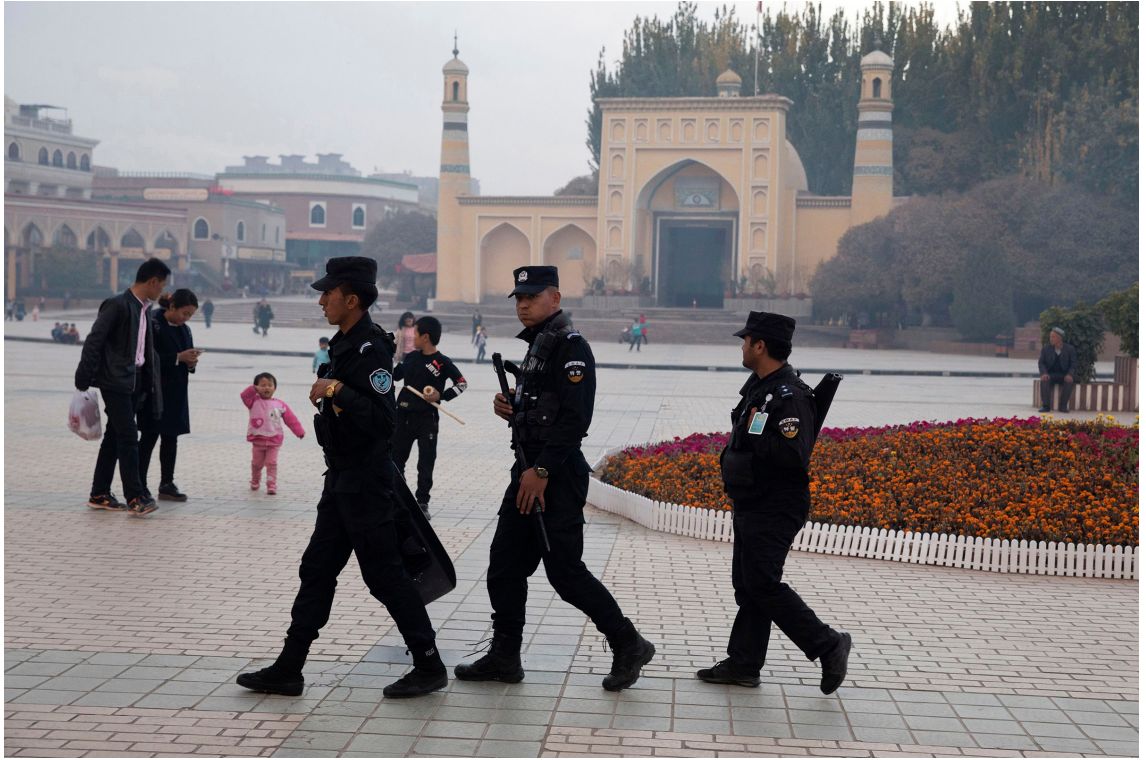
في الصورة: دورية للشرطة الصينية أمام مسجد عيدكاه، 4 نوفمبر 2017، كاشغر.