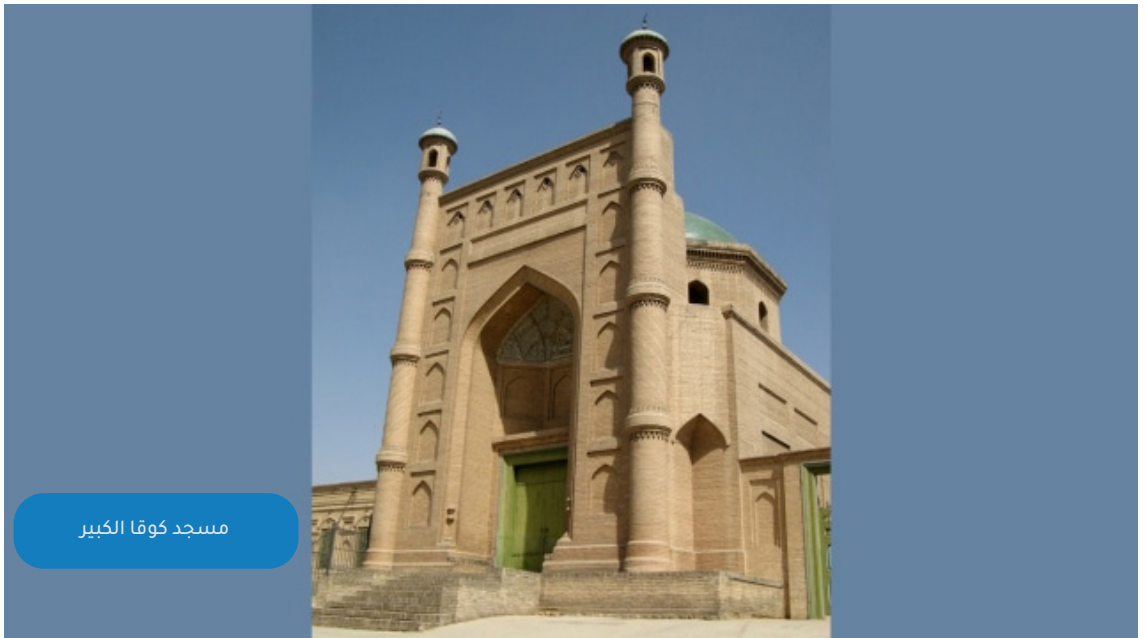
مسجد كوقا الكبير

تحقق الصحفية الصينية مكشوفة الرأس من خلال "النوافذ الشبكية الصينية" لمسجد كوقا.